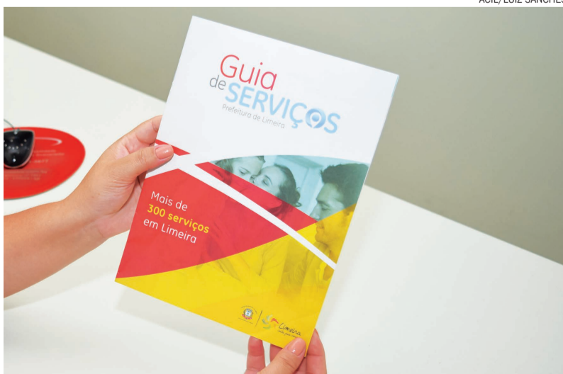
O material é composto por informações como endereço, telefone e horário de atendimento dos setores e equipamentos públicos