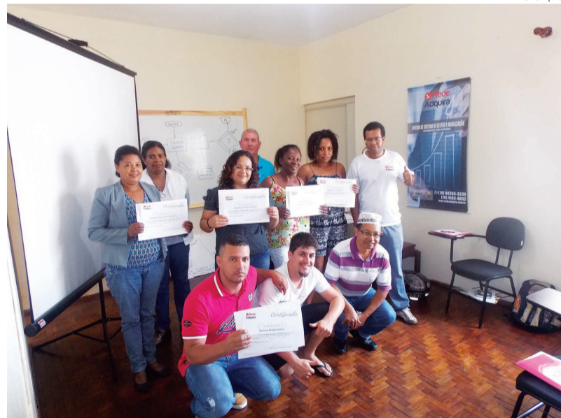
Todos os alunos da Rede Adquira recebem certificados ao final de seu curso, comprovando sua capacidade para o mercado de trabalho

Com o lema “Quebramos barreiras para o seu crescimento!”, a Rede Adquira convida a todos para conhecer os cursos oferecidos para a capacitação profissional. Para mais informações basta acessar o site www.redeadquira.com.br , ou entrar em contato pelo e-mail vendas@redeadquira.com.br , telefone (19) 4103-4003, ou pelo Whats App 98364-3330.