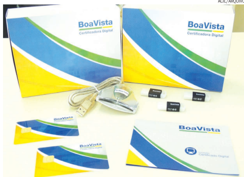
Os certificados também podem ser adquiridos na ACIL, que conta com um Posto da Certificação Digital que é administrado pela Autoridade de Registro Boa Vista

De acordo com dados da Associação Nacional de Certificação Digital, a ANCD, o número de emissões de Certificados Digitais em 2015 chegou em 3.280.537, o que aponta um crescimento de mais de 28%